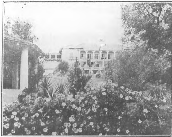
La casa, alejada de la calle, apartada de ella por macizos de flores y elegantes arbustos, se ofrece con aspecto de misterio a los ojos curiosos del transeunte.....

y un alegre trinar de golondrinas, entre el oro del sol por sus ventanas?).... Y dentro de la casa, orden, limpieza,