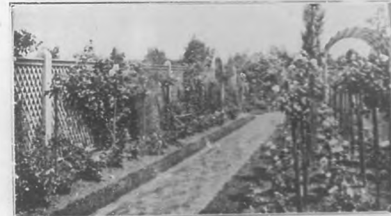
Una cama de rosales junto a la verja es de gran efecto artístico y deleita la vista del transeunte.

días de lluvia se contempla en ciertas partes de ese barrio aristocrático: chalets y jardines como islas en un mar de loteroscos más atención y sobre todo, resalta la nota fea de que al lado de casas con jardín se encuentran otras igualmente