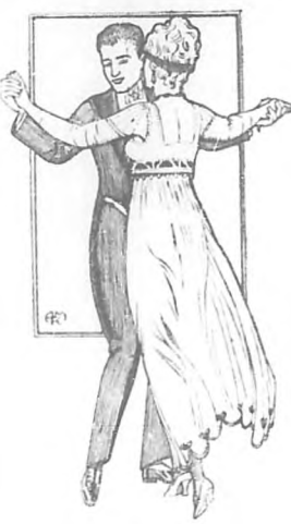
Lámina número 15.

Se dice que tiene más de ciento setenta figuras; pero no os aterroricéis; las principales, las que os habitúan para bailar lo bien en cualquier parte, apenas pasan de diez.