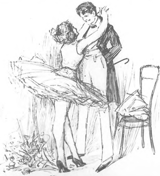
Costaba un poquito más de mil pesos.

de angustia; trato sin embargo de dominarse y se pasó con mano temblorosa el pañuelito por los labios.