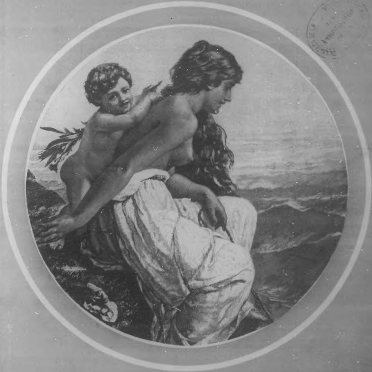
DIA DE VERANO Cuadro por W. Kray.