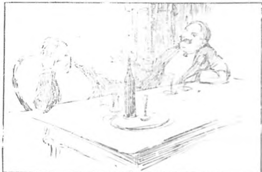
Admiró las bellezas de los colores

bufete y se dirigió al club. Al entrar le saludó desde una butaca un hombre bajito, regordete, calvo, de cara redonda y roja; representaba lo menos 45 años, tenía la fisonomía placentera y despreocupada de un hombre de negocios, alegre y soltero; al acercarse Gustavo dejó sobre la mesa próxima un libro que estaba leyendo y se quitó los lentes: "¿Ven acá, pícaro, ya se que heredas dos o tres millones!... ¿Que, si Amalia ha tenido siempre una suerte loca, cuando no tiene un millonario se consigue un cualquiera que a los tres días se vuelve millonario! Vaya, ¡sientate, llama al camarero y tomemos algo!"