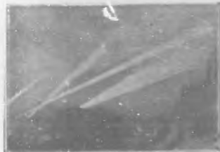
Paris visto desde las alturas de Montmartre al pasar un zeppelin la noche del 20 al 21 de marzo.