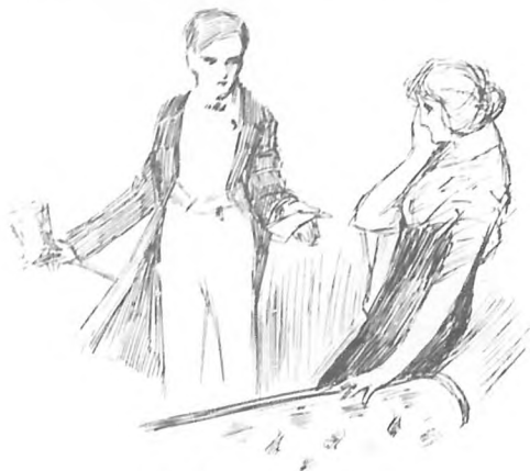
Dejó escapar un pequeño grito

Un momento después la señorita María entró, vestida de negro, con un chal de seda blanco sobre los hombros y un pañuelito de encaje en la mano; su cara delgada y enfermiza estaba más pálida que de costumbre y sus ojos indicaban que