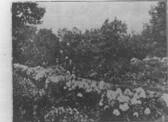
Hasta las flores más sencillas y comunes tienen una gran belleza; con humildes plantas se puede lograr un tesoro de belleza y de perfumes.....

do. Y en cuanto a lo que especialmente nos ocupa, los jardines, es de lamentar que no se les conceda en esos barrios pin-