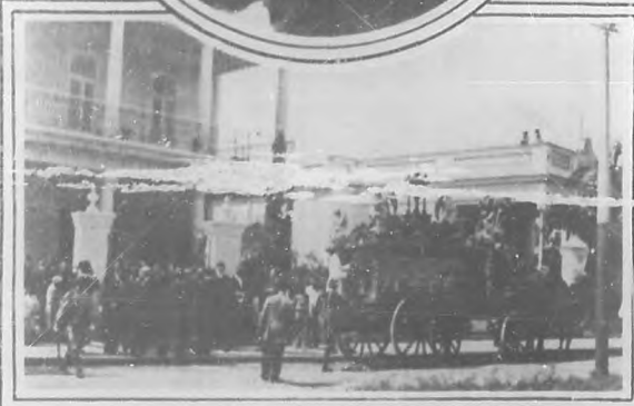
EL ENTIERRO SALIENDO DE LA CASA MORTVORIA