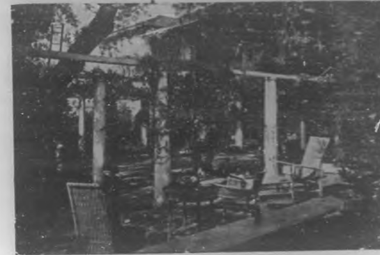
Quando la tarde a declinar empieza encontramos en ese delicioso lugar el mejor retiro para leer.....

Prodigios de hermosura y buen gusto se encuentran en esos barrios, orgullo de nuestra capital. Regias mansiones, coquetones jardincitos llenos de gracia, calles arboladas... Pero mucho les falta para su perfección: las calles, principalmente las del Vedado, están en pésimo estado y es vergonzoso el espectáculo que en algunos