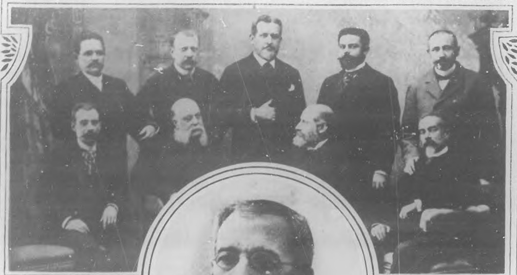
LOS COMISIONADOS POR LAS DE LA