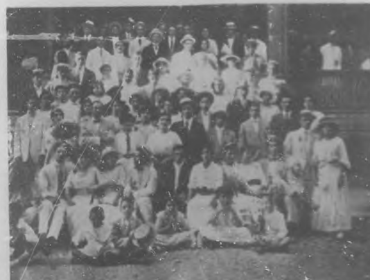
Un grupo de concurrentes a la matinee celebrada en "Palatino" de la Cervecería Tivoli por la Sociedad de Recreo e Instrucción "La Nacional" de Medina, Vedado el día 6 de Junio.

Este nombramiento ha sido acertadísimo, por haber recaído en un joven culto y estudio-